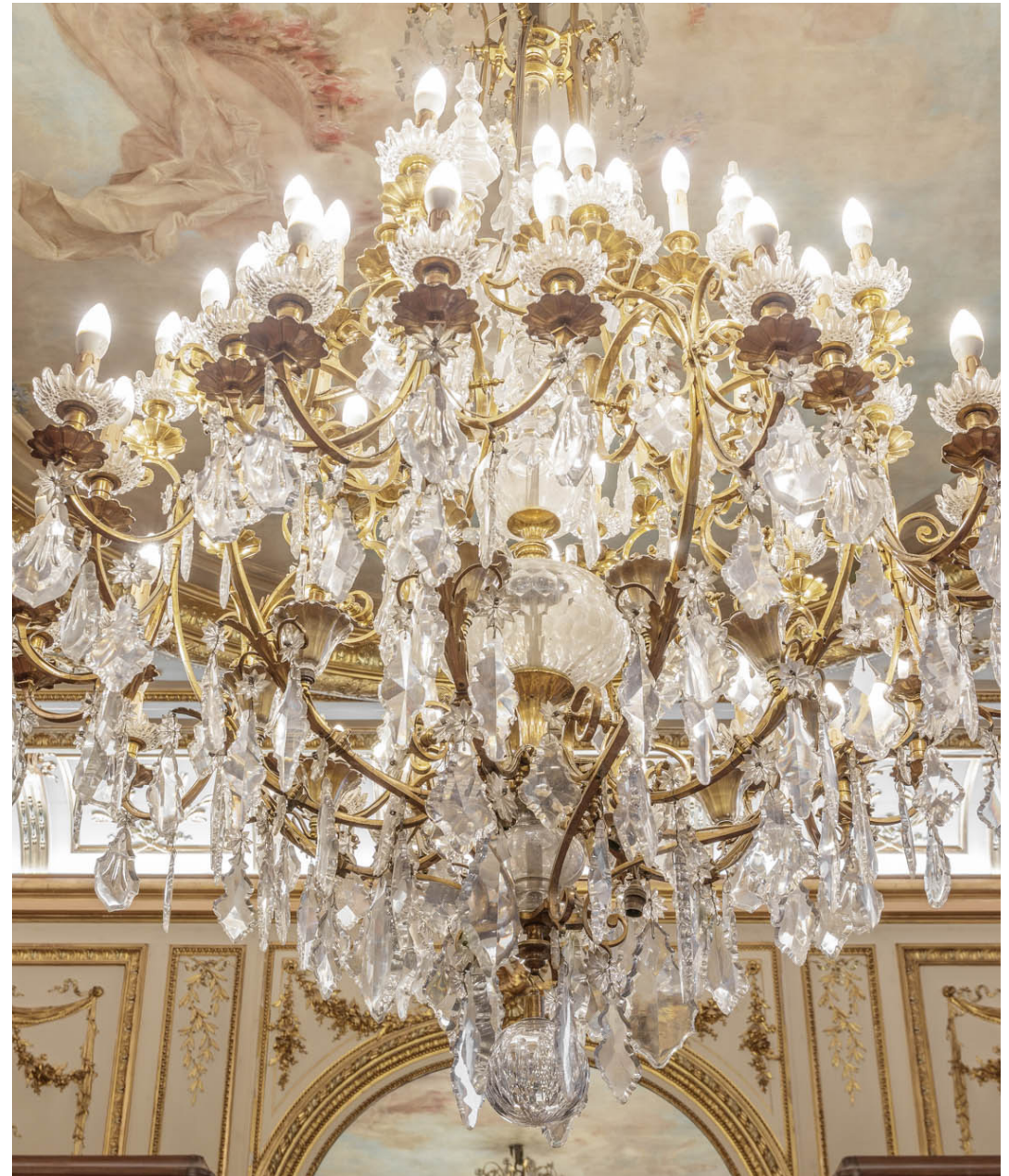
LE SALON D'HONNEUR